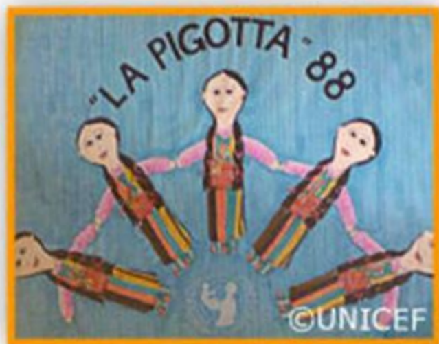
"La prima locandina"