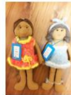
만나 & 열사